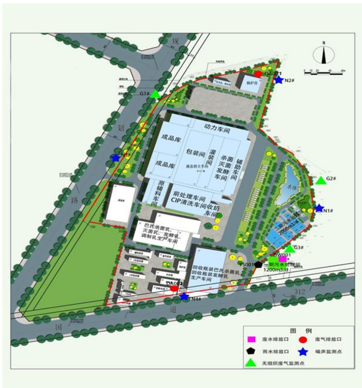
图1-3 监测点位示意图