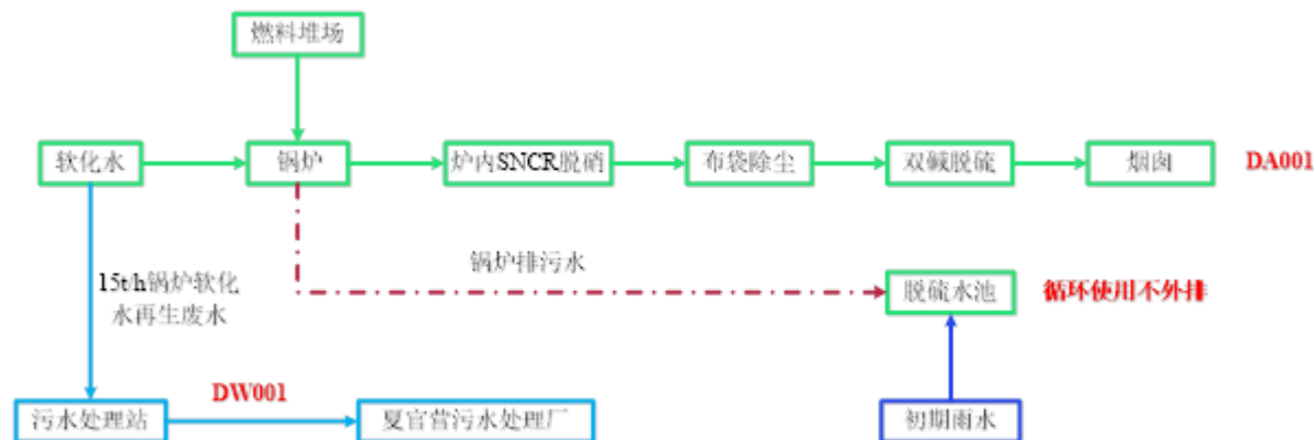
图1-2 锅炉生产工艺流程及产污节点图